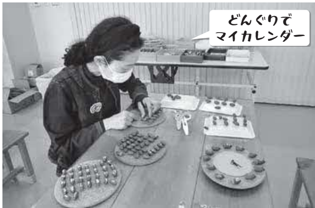
どんぐりでマイカレンダー