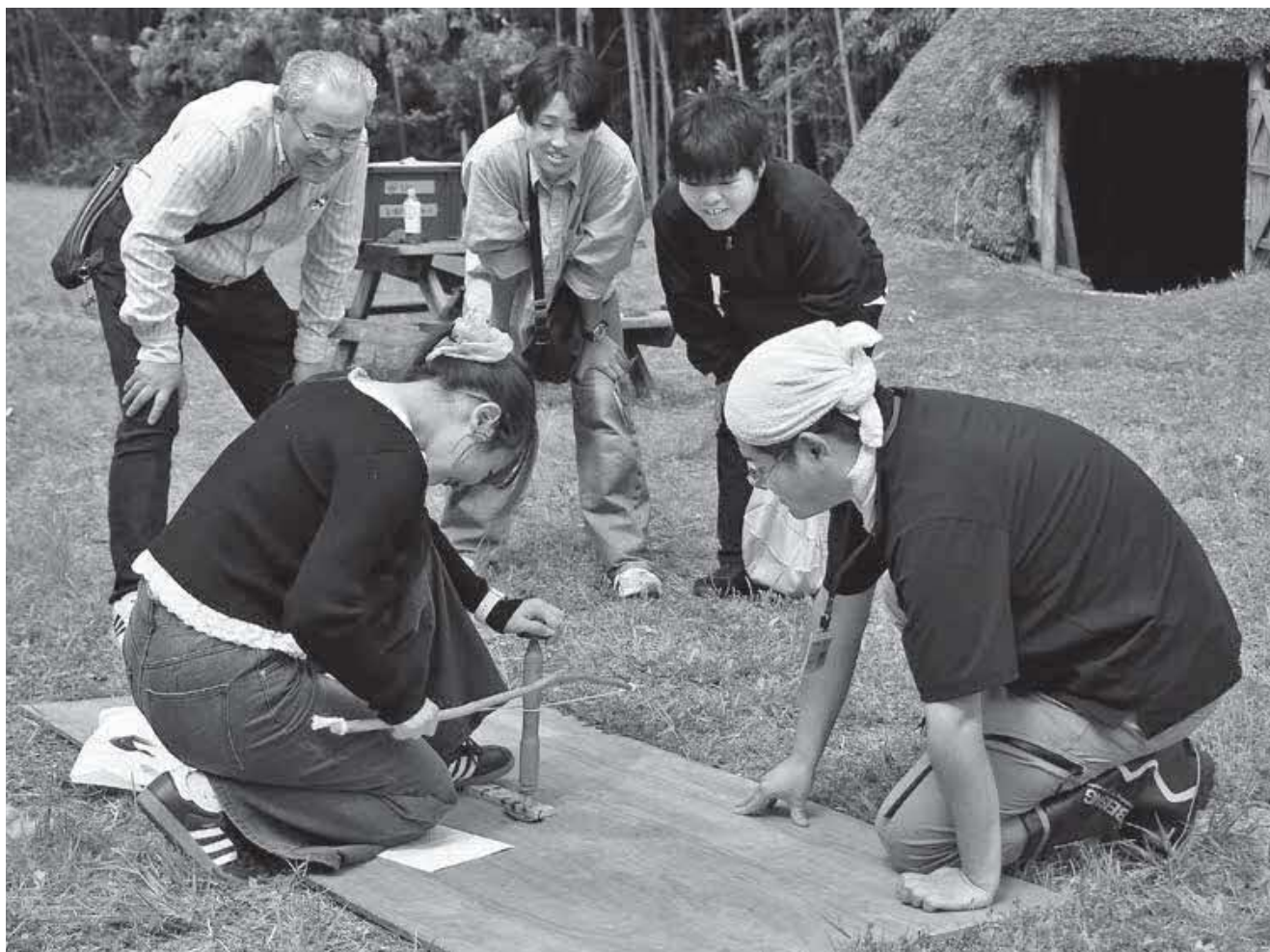
▲火おこしにチャレンジ！火種ができるかな。みんなの期待を一身にうけて……。 (緊張する～！)