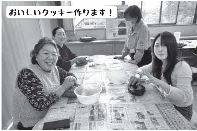
おいしいクッキー作ります！