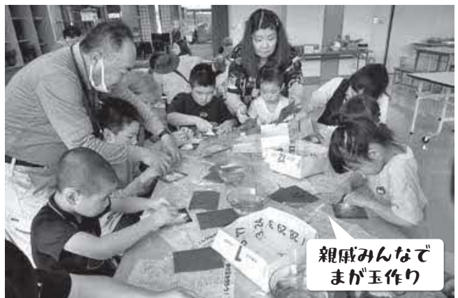
親戚みんなでまが玉作り