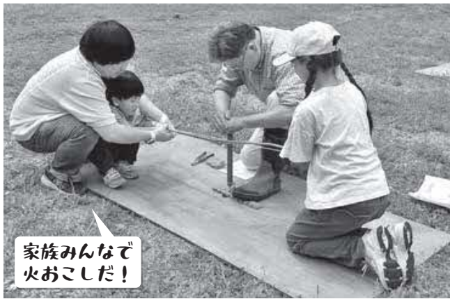
家族みんなで火おこしだ！