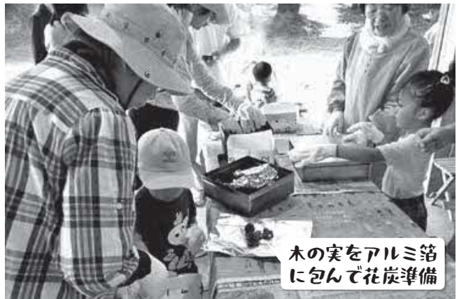
木の実をアルミ箔に包んで花炭準備