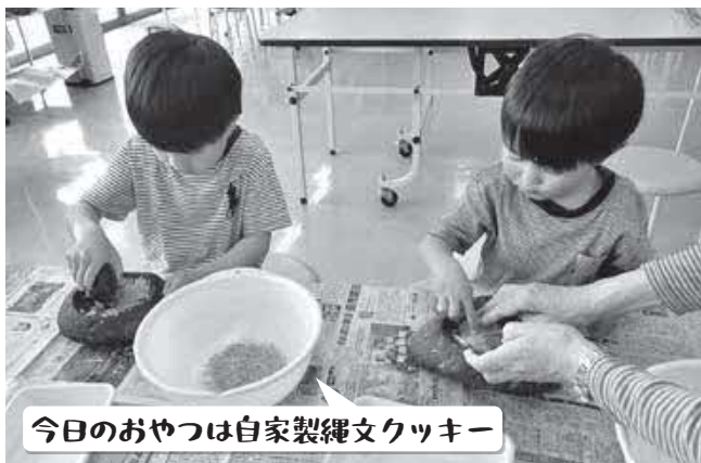
今日のおやつは自家製縄文クッキー