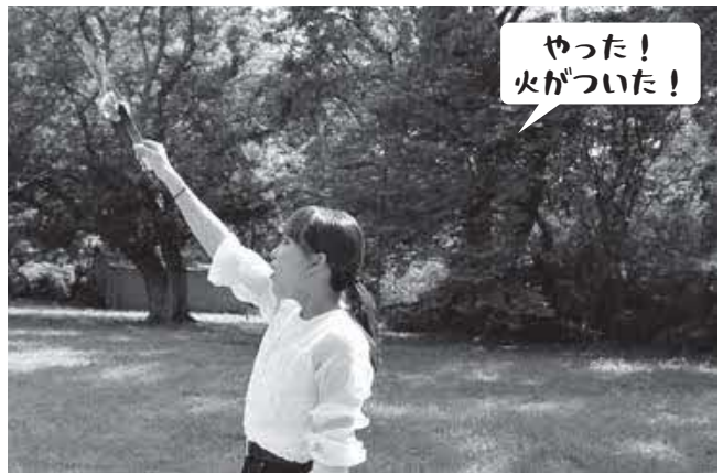
やった！火がついた！