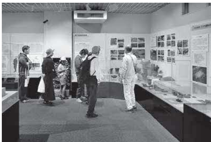
▲陸平貝塚見学ツアーは展示室からスタート

陸平貝塚のPRは美浦村のPRにもつながり、村外から訪れた人は好印象をもってお帰りになられている様子がうかがえました。