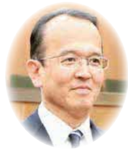
まつむら ひろし 松村 広志 議員