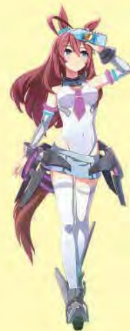
ミホノブルボン 栗東市のコラボキャラ