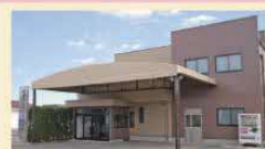
美浦セレモニーホール 60席 小～中規模の葬儀に