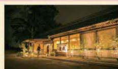
家族葬会館 霞風 24席 小さな家族葬専用