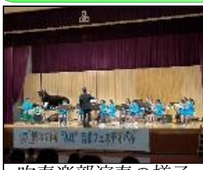
吹奏楽部演奏の様子