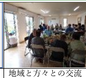
地域と方々との交流

11月4日(土)の午前、本校の科学部の生徒達が、木原浜地区資源保全活動のため、依頼を受けて木原地区の水質モニタリング調査を行いました。地区の子供会の小学生と共に、地区の5か所のポイント(用水路)の採水をし、pH・導電率・透明度の調査を行いました。その後公民館に戻り、さらにCODなどを調べ、多面的に水質を調べました。調べた水質については、過去のデータと比較しながら、地域の方と共有しました。その後、地域の方々が用意をしてくださった、そばや収穫したサツマイモをおいしくいただき