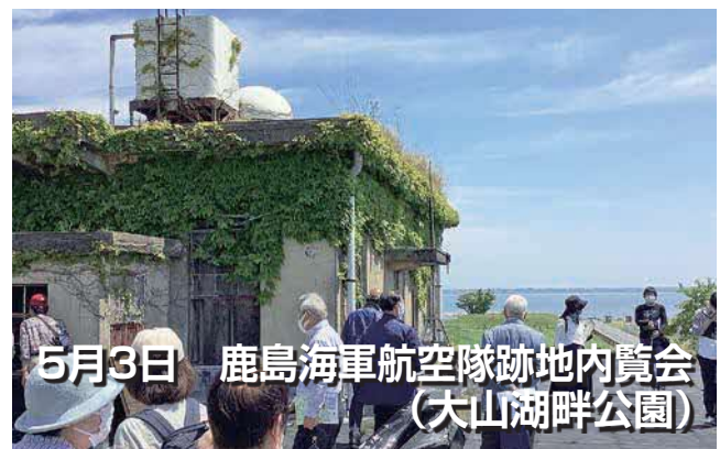
5月3日 鹿島海軍航空隊跡地内覧会 （大山湖畔公園）