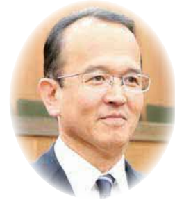
まつむら ひろし 松村 広志 議員