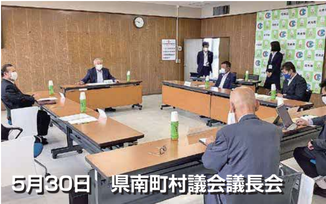
5月30日 県南町村議会議長会