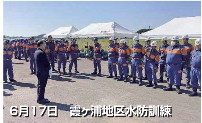
6月17日 霞ヶ浦地区水防訓練