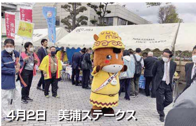
4月2日 美浦ステークス