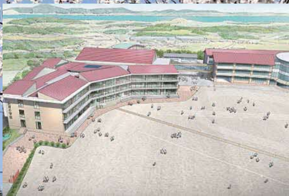
統合小学校 イメージ図

自主財源…村の権限で調達することができる収入のこと。 依存財源…国または県が関与する収入のこと。