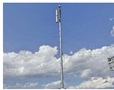
屋外防災行政無線