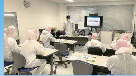
中西工場長(東海漬物:写真中央)

日本の食文化に欠かせない漬物のイノベーションを継続して時代のニーズに沿った開発・改良を促進。