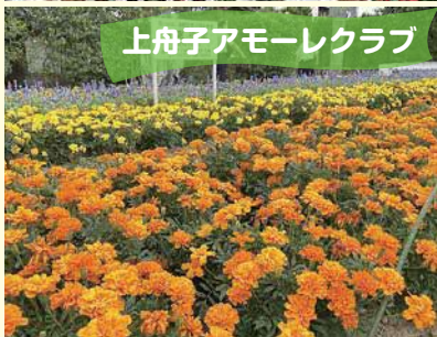
上舟子アモーレクラブ