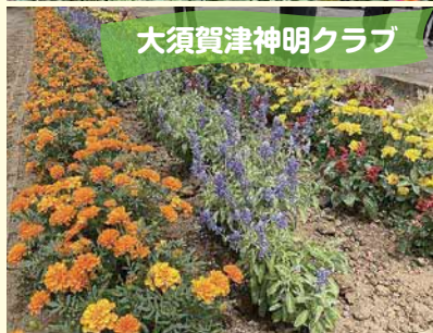
大須賀津神明クラブ