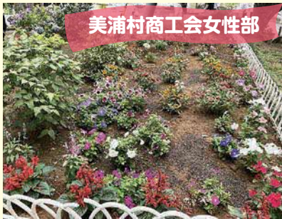
美浦村商工会女性部

環境美化に対する意欲の向上と住民相互の融和をはかり、きれいな地域づくりを推進することを目的として毎年開催されています。今年は6団体が参加され、村長や議長をはじめとする9名が現地審査を行いました。まさしく花いっぱいとなった各団体の花壇を紹介いたします。