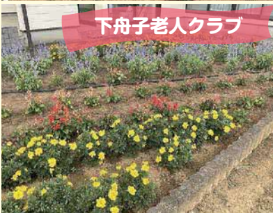
下舟子老人クラブ