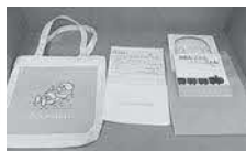
▲長く使えるバッグや絵本をお渡ししています

保健センターで毎月行われている4カ月児健診を受診できなかった方や、病院などで健診を受診された親子の皆さんを対象に、ブックスタート・パックをお渡ししています。ご希望の際は、母子手帳をお持ちのうえ、中央公民館図書室までお越しください。