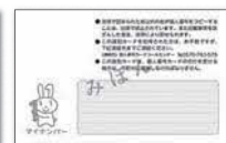
▲通知カードの見本▲