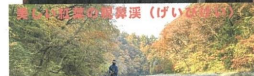
美しい紅葉の奥只見(げいげい)