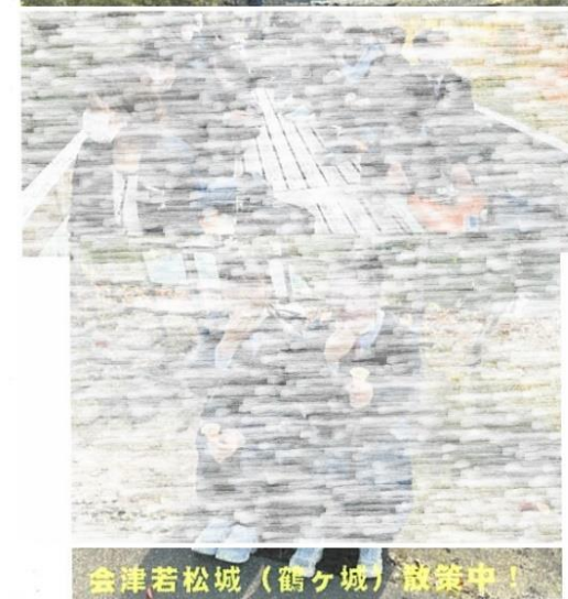
会津若松城(鶴ヶ城) 敷設中!