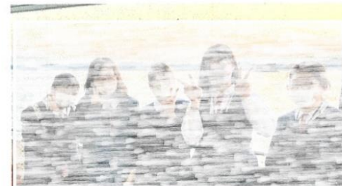
松島に浮かぶ島々を巡りました!