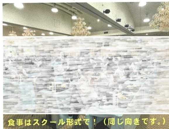
食事はスクール形式で!(同じ向きです。)