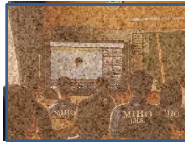
【前期終業式の様子】

2021年も残り2か月となりました。1年生にとっては、入学してから半年が経ち、ちょうど折り返しの時期となりました。何事も聞いて、受け身の行動が多かった4月とは大きく変化し自分たちで考えて、意見を出し合い、行動できるようになってきています。新型コロナウイルスの制約の中、例年通りの活動は難しいですが、その中でもどのような形であればできるのか、試行錯誤を続けています。先日の体育祭はまさに、生徒達が主体となって作り上げたものでした。11月の水泳教室、薬物乱用防止教室、12月のオープンスクールや生徒会役員選挙など多くの行事を通して、普段の授業では学べないことを体験し、成長していきたいと思います。