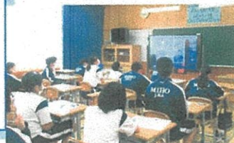
生徒の皆さんは各教室で！