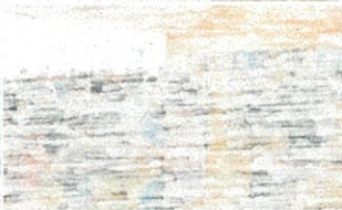
保護者の皆様は音楽室で！