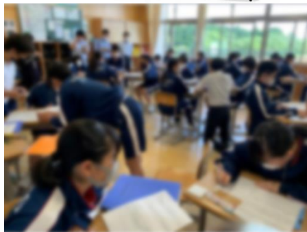
グループで真剣に意見を交流する様子 ↑