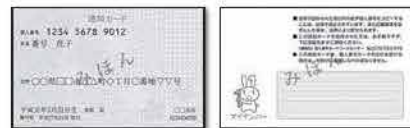
▲通知カードの見本▲