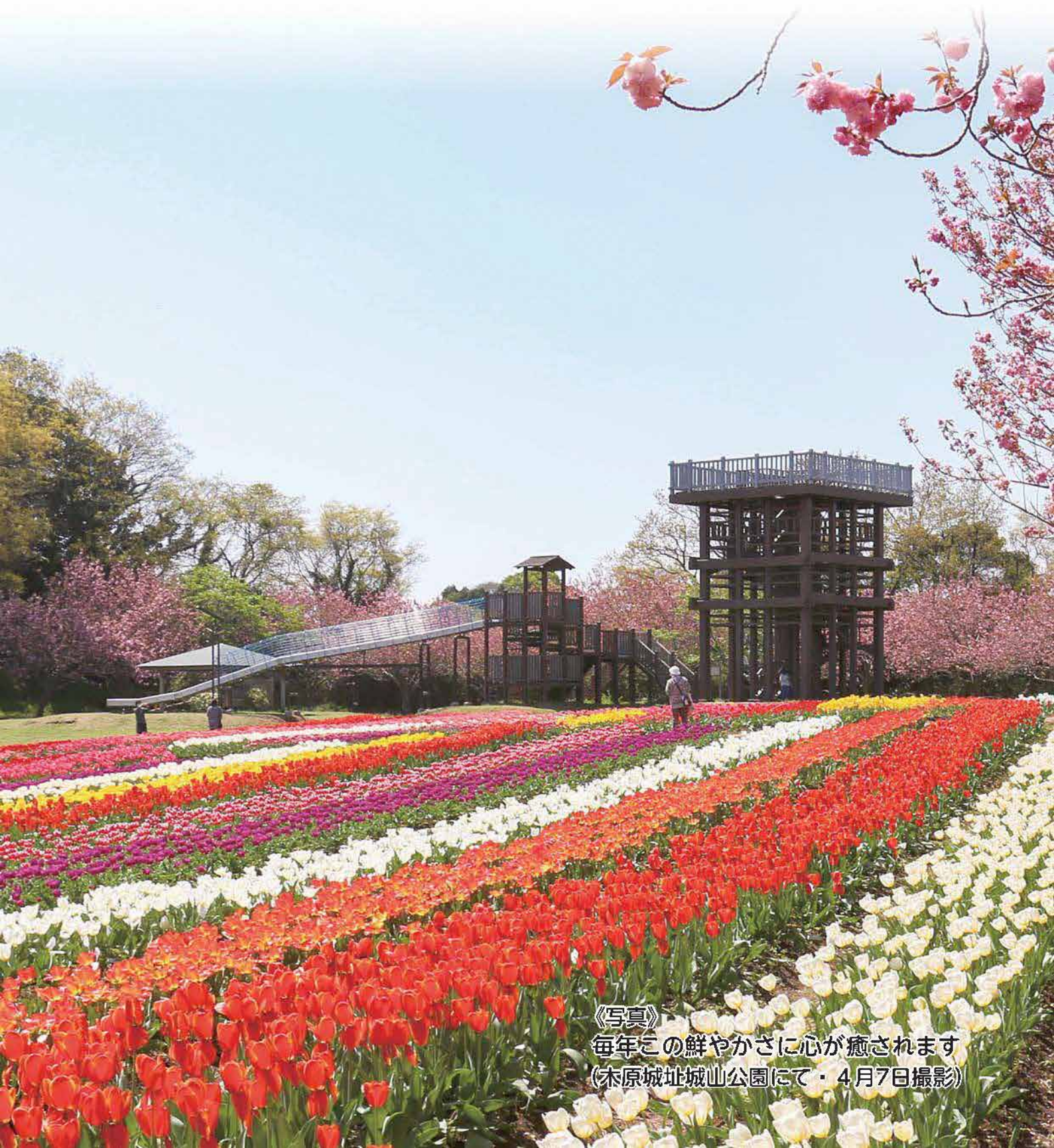
《写真》 毎年この鮮やかさに心が癒されます (木原城址城山公園にて・4月7日撮影)