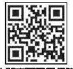
内閣官房国民保護ポータルサイト

実際にこのような事態に遭遇してしまった場合、1人ひとりが混乱すると対応の遅れや、新たな危険が生じてしまいます。どのように情報を得て、どのように行動すればよいのか、何が必要なかなどを日頃から学び、しっかり備えておきましょう。(第17回・終わり)