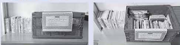
▲7月11日現在のリサイクルコーナーの状況です。