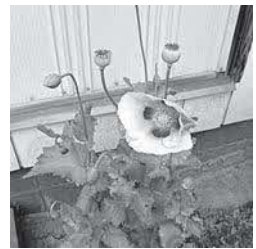
アツミゲシ 【セティゲルム種】