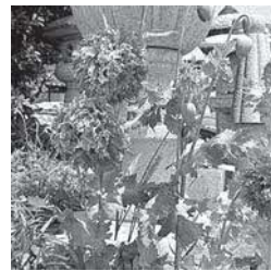
ケシ(八重) 【ソムニフェルム種】