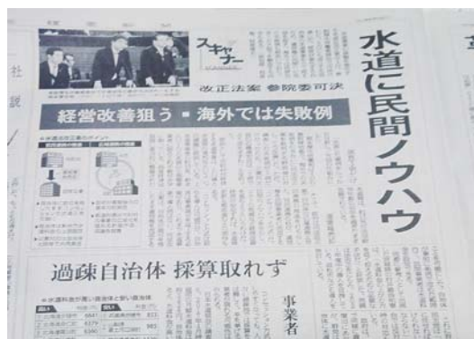
引用：読賣新聞 平成 30 年 12 月 5 日版

本村水道事業の安定した経営を最優先に、住民サービスの低下を招かないよう慎重に検討してまいりたいと考えている。