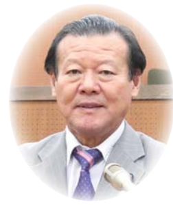
しもむら ひろし 下村 宏 議員