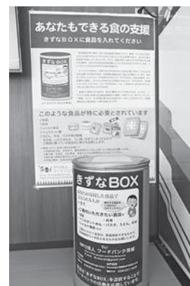
▲みほふれ愛プラザ1階

食品は常温管理できるもので、未開封、賞味期間が2カ月以上残っているものを直接「きずなBOX」に入れてください。