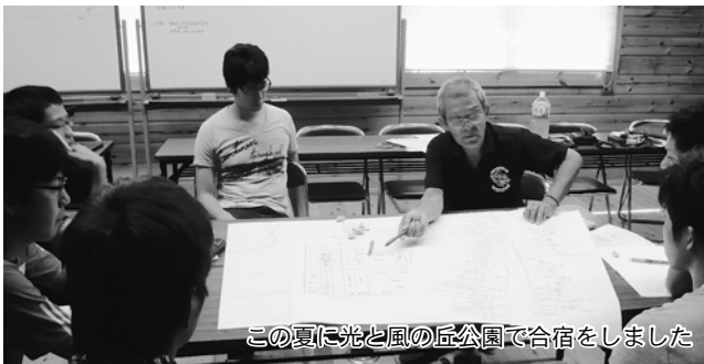
この夏に光と風の丘公園で合宿をしました

世界記録達成を目指す日本大学工学部航空研究会と「Möwe 28」号の大いなる飛躍を期待しましょう。