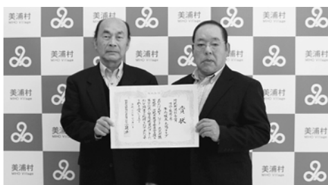
◎茨城新聞社長賞 牛込根本太陽クラブ

「花づくりは人づくり」花いっぱい運動で潤いのある豊かな地域づくりの輪がますます広がってほしいですね。