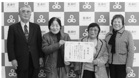
◎感謝状 山王福寿会