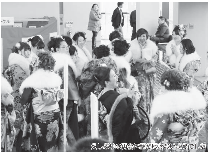
久しぶりの再会に話が尽きないようでした