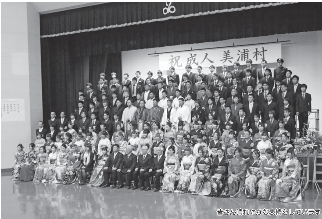
皆さん晴れやかな表情をしています