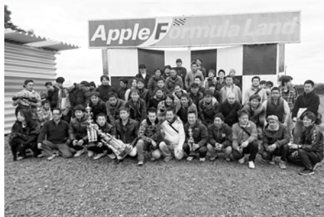
▲県南交流事業 (アップルフォーミュラランドにて)