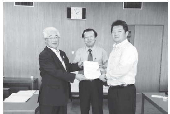
中島村長から回答書を受領

提言・要望では、「村内の基幹道路の整備について」「若者の人材育成について」を要望し、前向きに検討、協議していくとの回答でした。