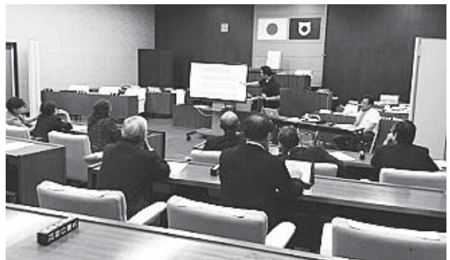
ICT 教育の先進的取り組みを研修

今回は、その市長の先進的な取り組みである「ICT教育」と、「武雄市立図書館」の視察を行いました。武雄市の ICT 教育は、