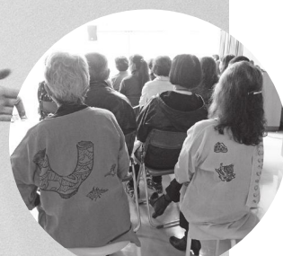
陸平にちなんだ土器や貝の絵の縄文服

さる10月22日開催予定の第20回陸平縄文ムラまつりは台風のため残念ながら中止となりましたが、会場で行う予定でした縄文の森コンサート（陸平をヨイショする会と共催）のみ文化財センターにて開催しました。