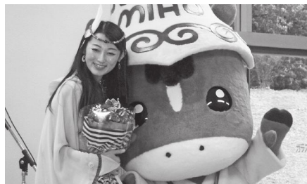
コンサートにみほ一すも登場