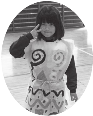
縄文時代に興味がわきました!

今年の陸平縄文ムラまつりでは縄文服コンテストが行われる予定で、事前に出店団体の皆さんはじめ、安中小学校児童の皆さんがまつりに向けて縄文服を作り、準備をしていました。当日は会場の陸平貝塚ですてきな縄文服を着た縄文キッズたちに出会えるはずでしたが、台風にはかありませんでした。そこでこの紙面にて安中小の皆さんが作った縄文服をご紹介します。会場で見えたかったですね!