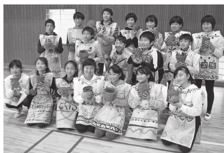
作った縄文土器を手に・・・ステージでの雄姿を見られず残念でした。

6年生はまつりで自分の作った縄文土器を紹介し、ステージ前に飾る予定でした。6月に陸平をヨイシヨする会土器部会の指導で縄文土器を製作し、10月に野焼きをして個性あふれる素敵な縄文土器が完成しました。また、俚謡コンテストにも4～6年生が日和吟社の指導を受けて味わいのあるうたを作り、参加してくれました。