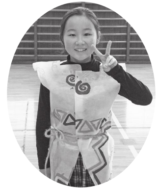
みんなで縄文服を作りました!

今年の陸平縄文ムラまつりでは縄文服コンテストが行われる予定で、事前に出店団体の皆さんはじめ、安中小学校児童の皆さんがまつりに向けて縄文服を作り、準備をしていました。当日は会場の陸平貝塚ですてきな縄文服を着た縄文キッズたちに出会えるはずでしたが、台風にはかありませんでした。そこでこの紙面にて安中小の皆さんが作った縄文服をご紹介します。会場で見えたかったですね!