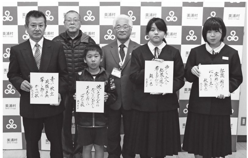
受賞された皆さん おめでとうございます