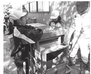
唐箕を使うと、風で粉の選別、うみこい